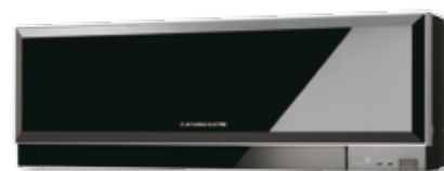
De ZEN-designlijn is verkrijgbaar in 3 kleuren

Voor iedere situatie heeft Mitsubishi Electric een passende binnenunit. Zowel voor de manier waarop het systeem in uw woning geïntegreerd kan worden, als voor uw functionele wensen in koelen, verwarmen, ventileren en ontvochtigen. Daarom hebben wij 6 series met verschillende modellen, capaciteiten en mogelijkheden. Allen met een hoge efficiëntie, laag energieverbruik, ideale uitblaaspatronen en een laag geluidsniveau. Naast op- en onderbouwoplossingen ook leverbaar in geïntegreerde systemen.